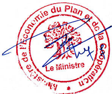
Monsieur Doudou KA Ministre de l'Economie, du Plan et de la Coopération