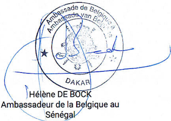
Hélène DE BOCK Ambassadeur de la Belgique au Sénégal