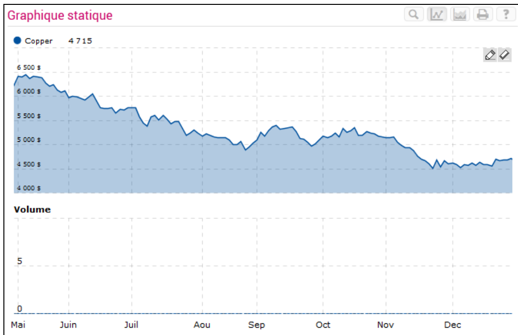
Cours de cuivre de mai 2015 – décembre 2015

Entretemps, des initiatives sont multipliées ici et là afin d'avoir des sources complémentaires d'énergie ; des prospections menées pour dénicher des chutes pouvant permettre d'ériger des micro-barrages hydro électriques.